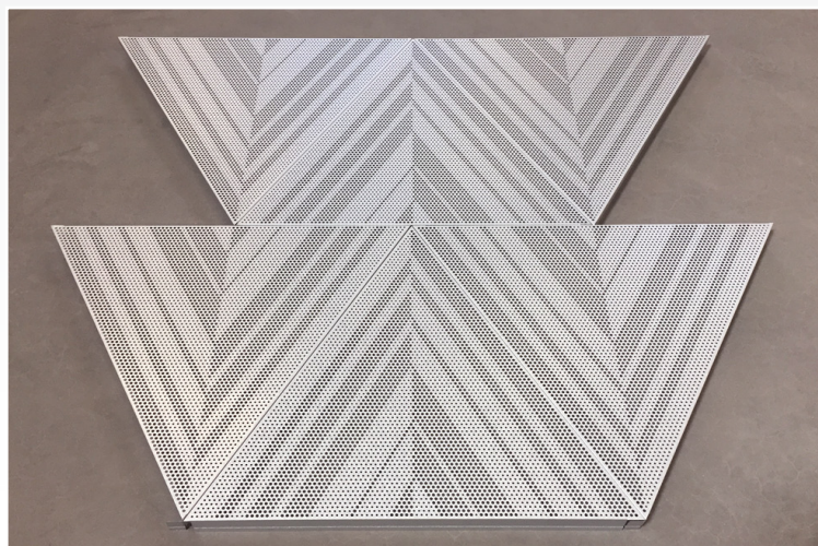
Montage: Modulparallell. | Perforering: 3D Trinity.